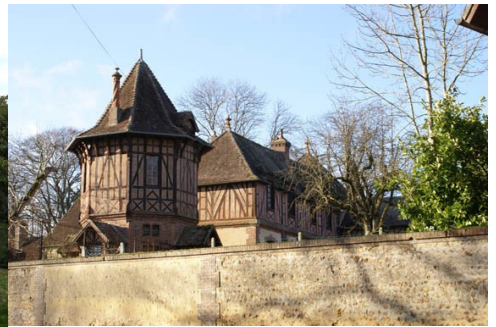
La maison du gardien et le colombier