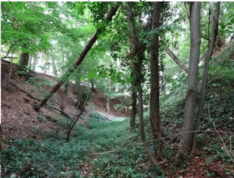
Les anciens fossés royaux de l'Avre