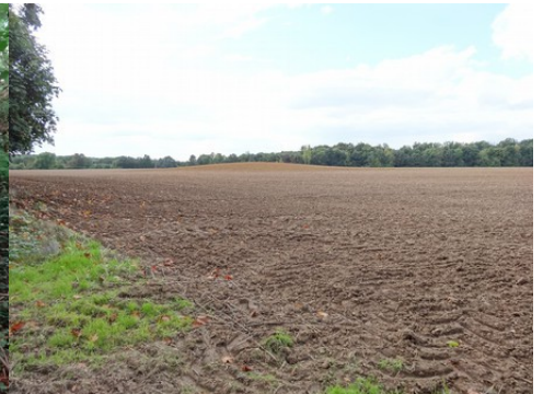
Les champs et les bois alentours