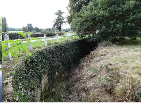
Le saut de loup