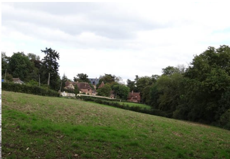
Le château vu de loin