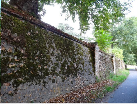
Le mur d'enceinte