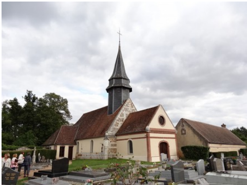
L'église de Courteilles

Les avis seront cohérents avec ceux émis ces dernières années, à savoir : pas de maisons à volume compliqué (type V, W, Y, ou Z), pentes à 45° pour les volumes principaux, ardoise ou tuile plate de teinte brun vieilli, à 20u/m², avec un débord de toiture de 20cm, enduit de teinte beige clair avec modénatures (au choix : chaînages, encadrement de fenêtres, soubassement, colombage...). *Voir les autres fiches.